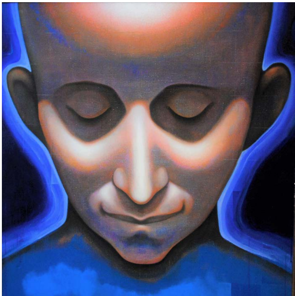
SNĚNÍ, 140 x 140 cm, akryl a olej na plátně, 2011