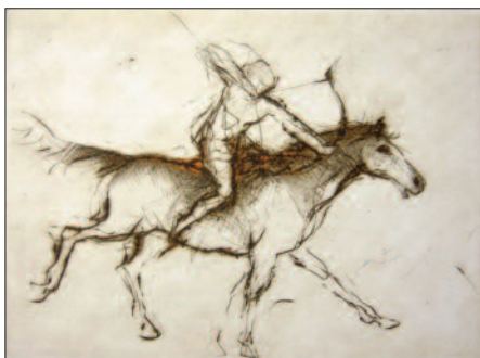
STÍHÁNÍ , 2009, suchá jehla