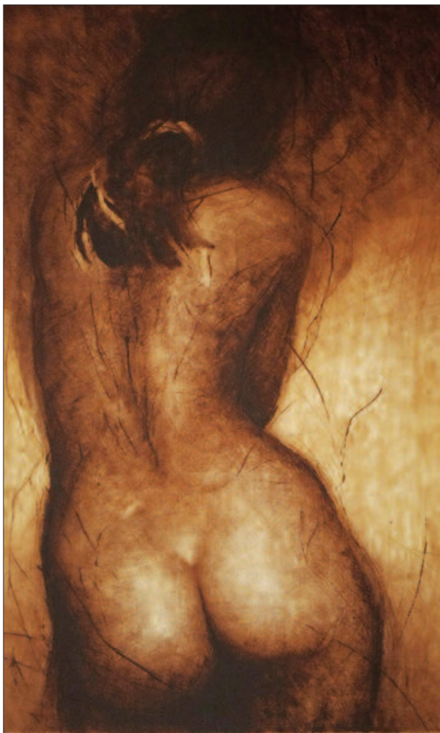
KE ZDI 2005, suchá jehla