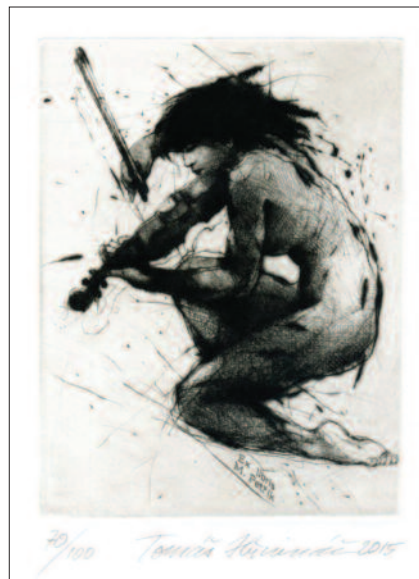
Housle , 2015, suchá jehla