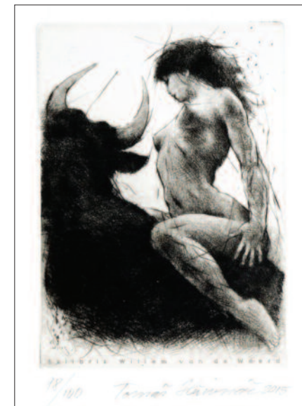
Únos Evropy , 2015, lept