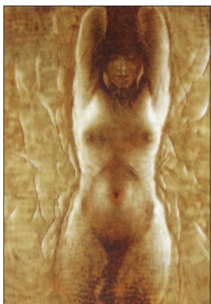
Z OBOU STRAN , 2007, suchá jehla

Zdroj: Slovník Českých a slovenských výtvarných umělců, Ostrava, 1999