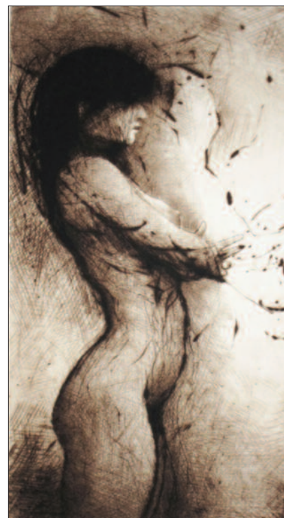
ÚMYSL II. , 2002, suchá jehla