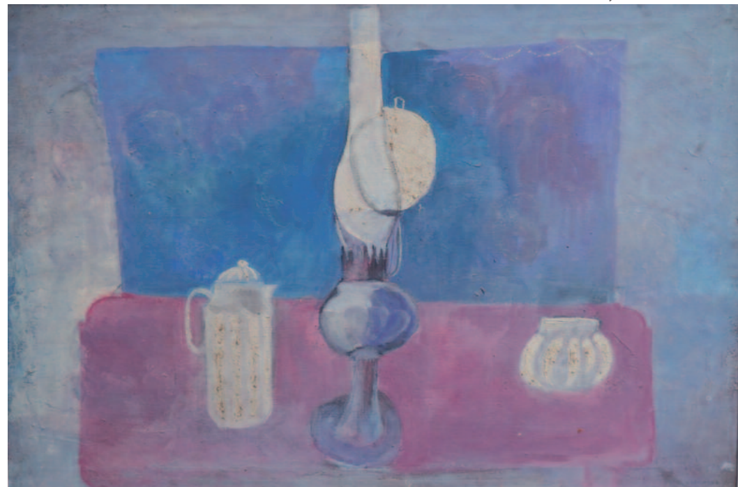
Vladimír Komárek – Zátiší s petrolejovou lampou, olej, nedatováno, 80 x 59 cm