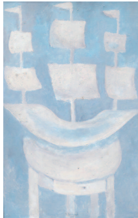
Vladimír Komárek – Loď, olej, 1965, 36 x 57 cm