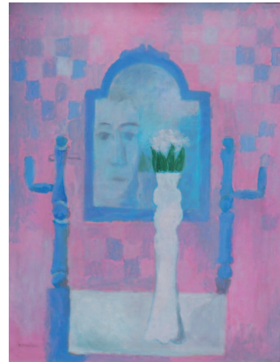
Vladimír Komárek – Tvář v zrcadle, olej, nedat. 60 x 80 cm