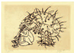
Stanislav Holý Acaropsis sollers 1979 novoročenka 13 x 8,5 cm