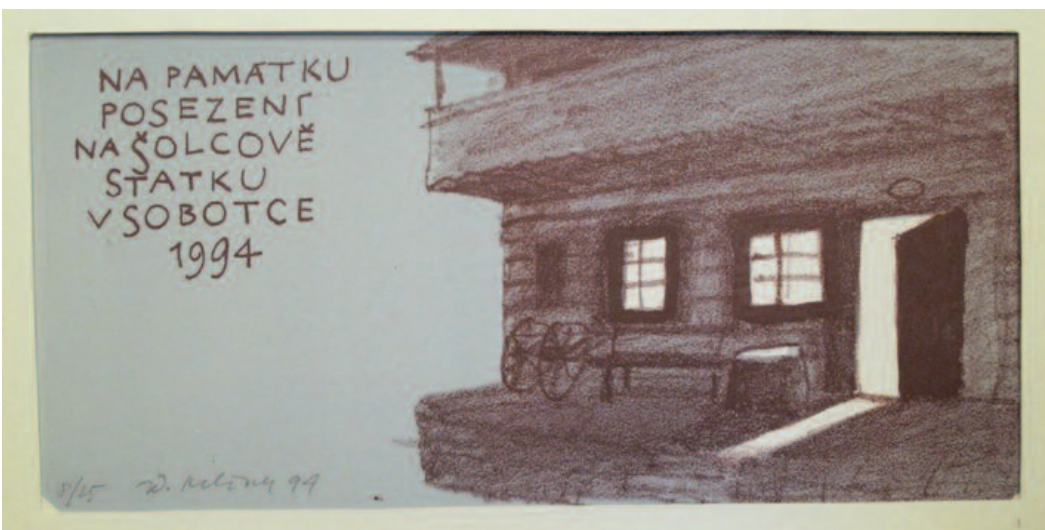
Zdeněk Mlčoch – Posezenka, 1994, 14 x 7,5 cm

Šolcův statek v Sobotce - Galerie Karla Samšišáka